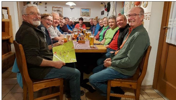
Nach der Priehetsberg-Wanderung in der Pizzeria Marina.

Grein: GH Zur Traube, Greinburgstraße 6, von 16.00 Uhr – 17.30 Uhr